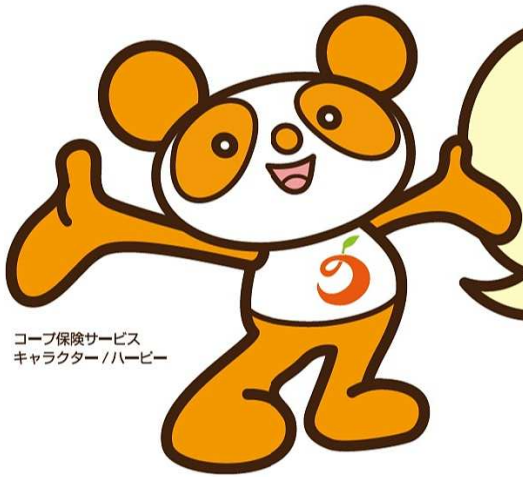
コープ保険サービス キャラクター/ハービー